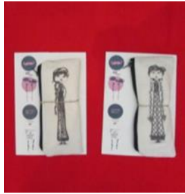
Κασετίνα με φιγούρα εμπνευσμένη από την κυπριακή παράδοση Τιμή: 12 ευρώ