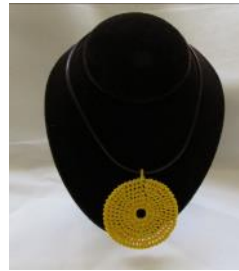
Κολιέ κροσέ Τιμή: 15 ευρώ