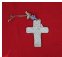
Σταυρός, τύπου Φυλακτό Τιμή: 10,5 ευρώ