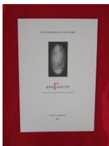
Στέλλα Βοσκαρίδου Οι- κονόμου, Αναγέλαστα Ποιητική συλλογή €8