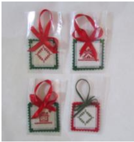
Κέντημα χριστουγεννιά- τικο στολίδι Τιμή: 2,5 ευρώ