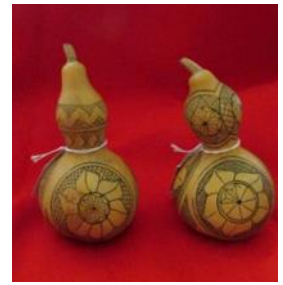
Κολοκύθα εγχάρακτη με το παραδοσιακό μαχαι- ράκι Τιμή: 9 ευρώ