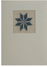
Ευχετήριες κάρτες με επιλεγμένα παραδο- σιακά μοτίβα από το Μουσείο. Ενσωμα- τώνουν χειροποίητο κέντημα, Τιμή: από €4.50