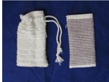
Μάλλινες θήκες κινητού, υφαντές στον αργαλειό, Τιμή: από 8 ευρώ