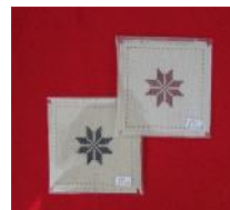
Σουβέρ κέντημα για τα ποτήρια σας Τιμή: 3 ευρώ