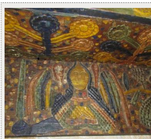
Άγγελος, λεπτομέρεια από ξύλινη σουβάντζα Ακανθού Συλλογή Μουσείου Λαϊκής Τέχνης

..... Το Διοικητικό Συμβούλιο της Εταιρείας Κυπριακών Σπουδών σας εύχεται Καλά Χριστούγεννα.