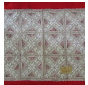
Λευκαρίτικο κέντημα, Τιμή: 31 ευρώ

Στηρίζτε κι εσείς την παράδοσή μας. Αγοράστε μοναδικά δώρα εμπνευσμένα από την παράδοσή μας και στηρίζτε το Μουσείο Λαϊκής Τέχνης Κύπρου (ιδρ. 1937), στην προσπάθειά του να συντηρήσει τα εκθέματά του.