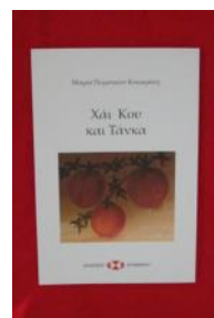
Μαρία Περατικού Κο- καράκη, Χάι Κου και Τάνκα, Ποιητική συλλο- γή €6,50